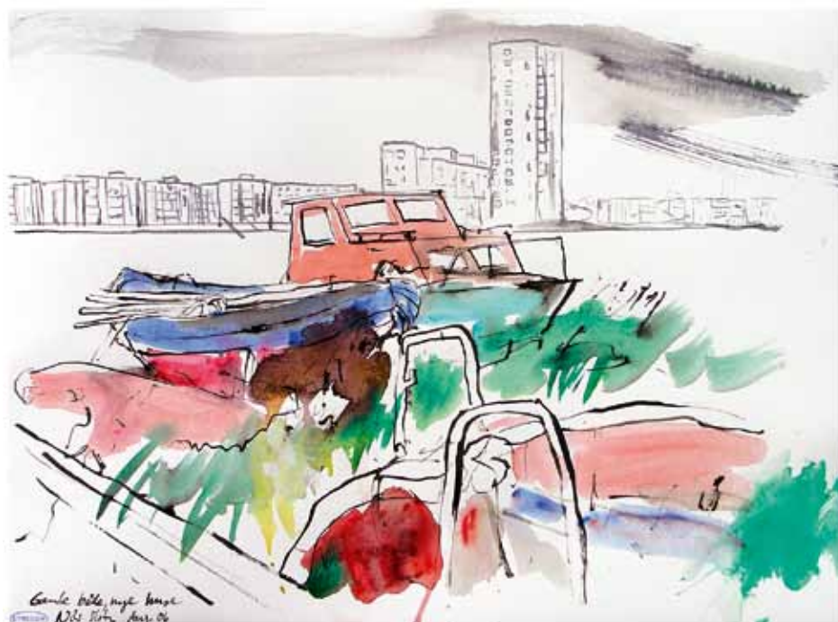
I august 2006 udførte Nils Slot hver dag mindst tre tegninger fra Aalborg. Denne er fra området ved Skudehavnen, "Gamle både, nye huse". (Fra bogen "STREGER")