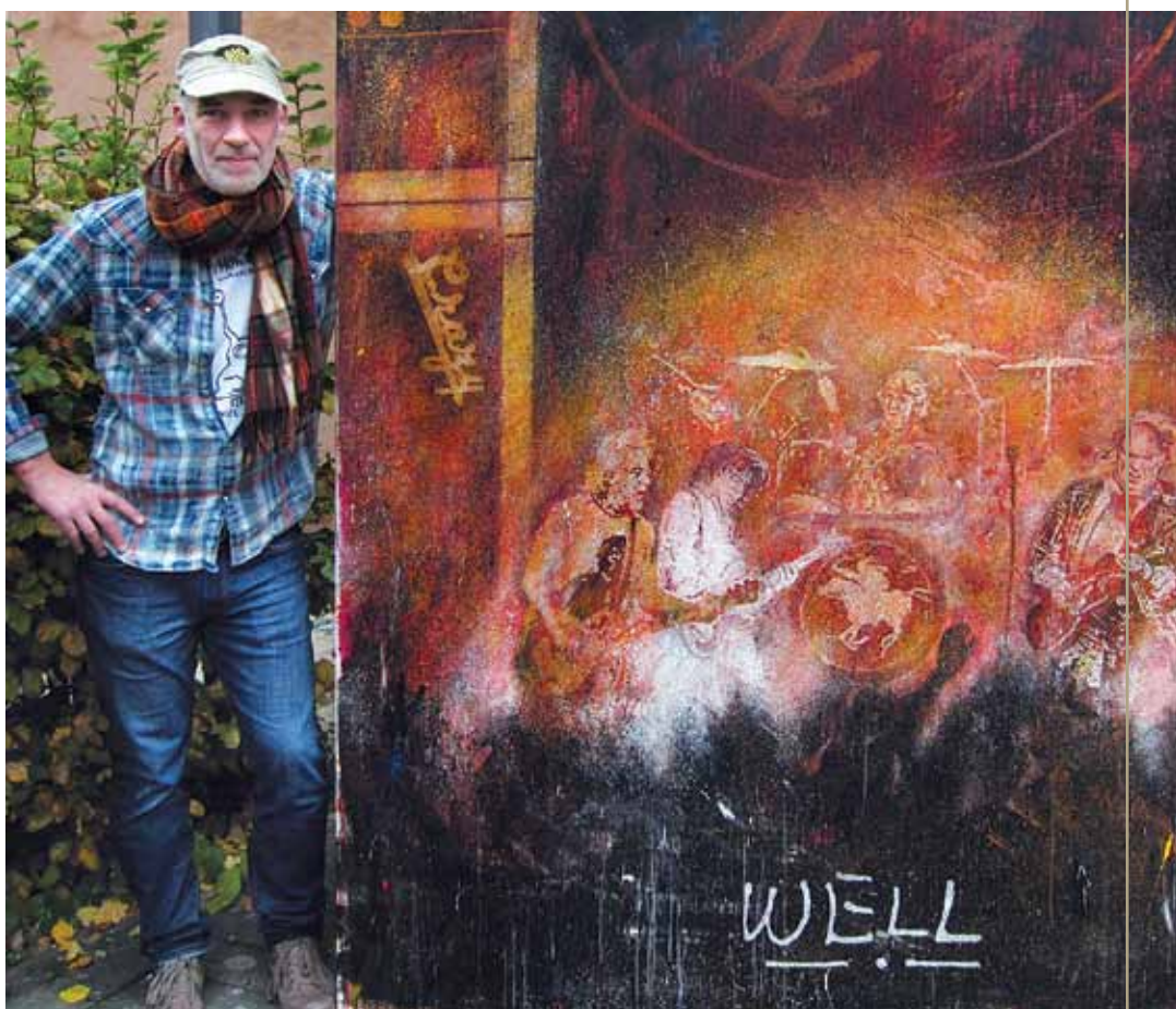
Rockmusikken er en af Nils Sloths markante inspirationskilder

I sommeren 2012 flyttede "Artbreak Hotel" til Danmarksgade 62. Her er