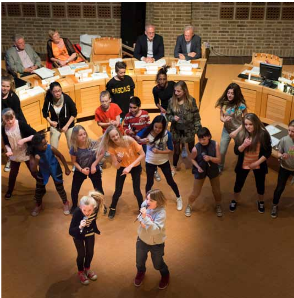
Også til legatfesten 2013 gav de unge fra Fristedet et medrivende show i byrådsalen

Den 18. oktober blev der taget første spadestik til det ny universitetshospital i Aalborg Øst. Det er det hidtil største byggeprojekt i Nordjylland. Byggeperioden er syv år, budgettet 4,1 milliard kroner, og der forventes at være anvendt 3,3 millioner mandetimer, når de 135.000 m 2 indvies i 2020. Region Nordjylland har meldt ud, at udbuddene så vidt muligt vil blive